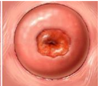
Rød plet og irritation

Sådan ser livmoderhalsen ud. Ved den gynækologiske undersøgelse er livmodermunden rød, irriteret og blødende ved berøring. Vævsprøverne viser som regel inflammation, som er en irritationstilstand.